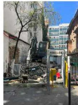
Cour Manin : démolition de la guérite