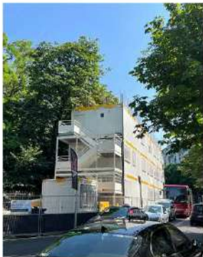
Rue Manin : base vie installée