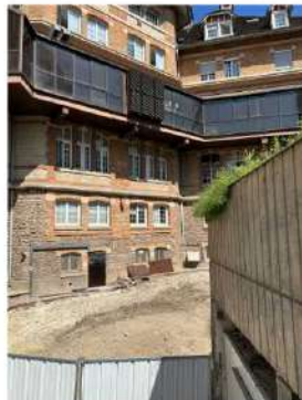
Cour Moreau : préparation de la zone pour les terrassements du tunnel