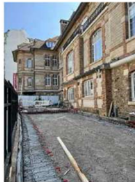
Cour Manin : travaux de génie civil pour le Groupe Electrogène et le poste HTA