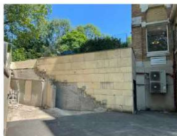
Entrée Hôpital : démolition de l'escalier menant au parvis