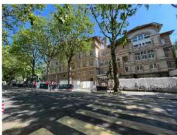
Rue Mathurin Moreau : zone logistique